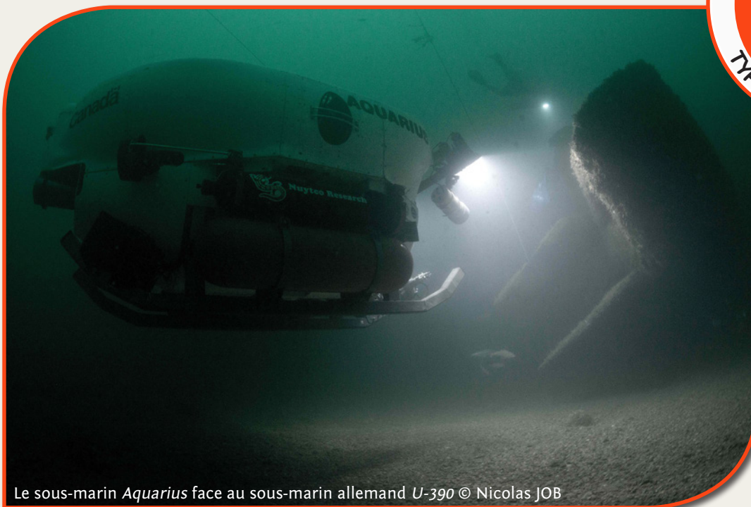
Le sous-marin Aquarius face au sous-marin allemand U-390