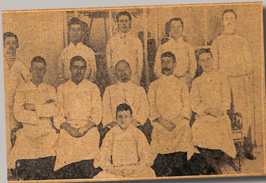
© La Cité de la Mer / The Daily Graphic 20 avril 1912

Soixante-deux personnes sont affectées aux cuisines de 1 re , 2 e et 3 e classe. Un cuisinier s'occupe spécifiquement de la préparation de la nourriture Kasher pour les passagers de confession juive.