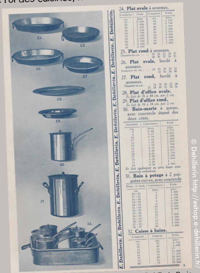
Extrait du catalogue de matériel culinaire Dehillerin, Paris aux alentours de 1910.

Bien qu'elle ne soit pas aussi grande et sophistiquée que la cuisine de 1 re et 2 e classe, le restaurant À la carte dispose de sa propre cuisine aménagée selon les normes les plus modernes élaborées par Auguste ESCOFFIER, « le roi des cuisines, le cuisinier des rois ».