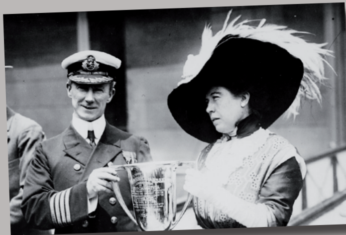
Molly BROWN remettant une coupe d'argent à Arthur ROSTRON

C'est en tant que présidente que Margaret BROWN remet, le 29 mai 1912, une coupe d'argent au Commandant du Carpathia , Arthur ROSTRON, et une médaille à chaque membre de l'équipage.