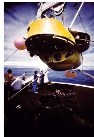
Mise à l'eau de Cyana