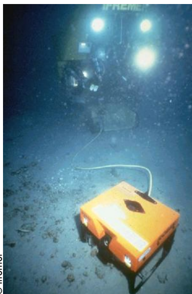
ROBIN : ROBot d'Inspection du Nautile

Le naufrage du Prestige est une des plus importantes catastrophes écologiques de ces dernières années. Plus de 64 000 tonnes de fioul se sont échappés du navire (il en contenait 77 000 tonnes). Toute une partie de la côte Atlantique, allant du nord du Portugal au sud de la Bretagne a été contaminée par les hydrocarbures.