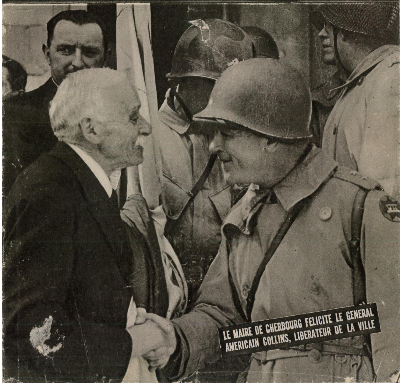
LE MAIRE DE CHERBOURG FELICITE LE GENERAL AMERICAIN COLLINS, LIBERATEUR DE LA VILLE