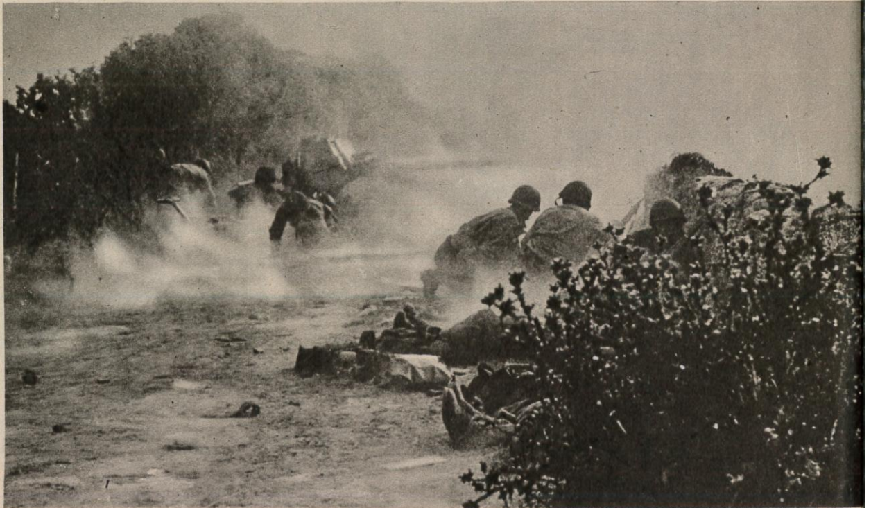
DES TROUPES D'ASSAULT AMERICAINES s'abritent derrière un mur pendant qu'un canon anti-tank détruit un nid de mitrailleuses allemand près de la ville.