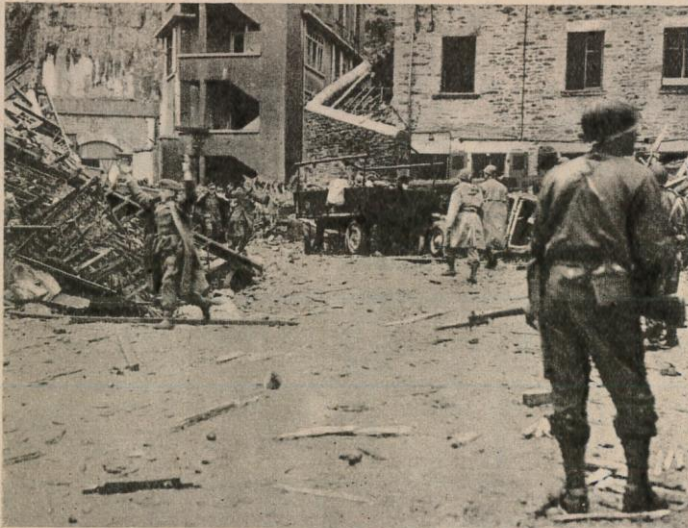
MAINS LEVEES des allemands, maîtrisés par les américains sortent de l'immeuble qu'ils avaient transformé en fortin.