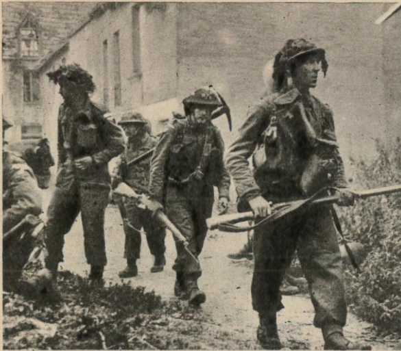
A PEINE TERMINEE la bataille de Cherbourg, la 2ème Armée britannique a lancé une offensive vers Caen.