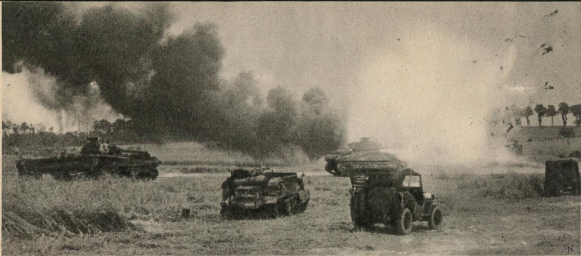
AU MOMENT DE LA PRISE DE CHERBOURG , les anglais attaquaient près de Caen les forces blindées de Rommel.