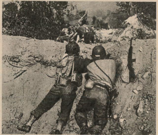
METRE PAR METRE les américains durent conquérir le terrain sur les allemands chargés de les arrêter.