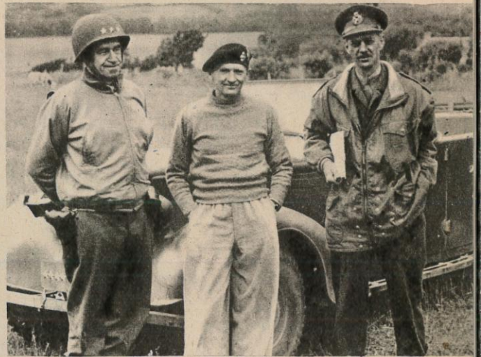
TROIS VAINQUEURS , les généreux Bradley, Montgomery, et Dempsey, commandant la 2ème Armée britannique.

LA TENACITE BRITANNIQUE a fait échouer tous les efforts de Rommel, et a immobilisé entre Tilly et Caen les divisions dont l'ennemi aurait eu si grand besoin pour défendre Cherbourg.