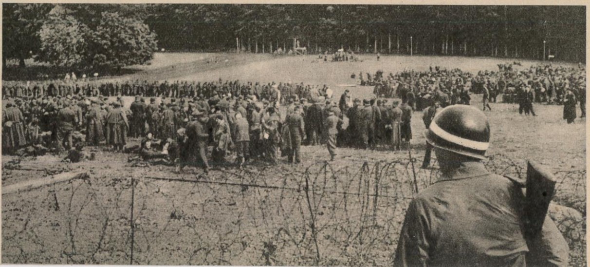
LE DRAME EST JOUE , les allemands ont perdu Cherbourg. Massés dans les prairies entourant la ville, les prisonniers semblent se dire que tout est préférable à l'enfer d'où ils sortent.