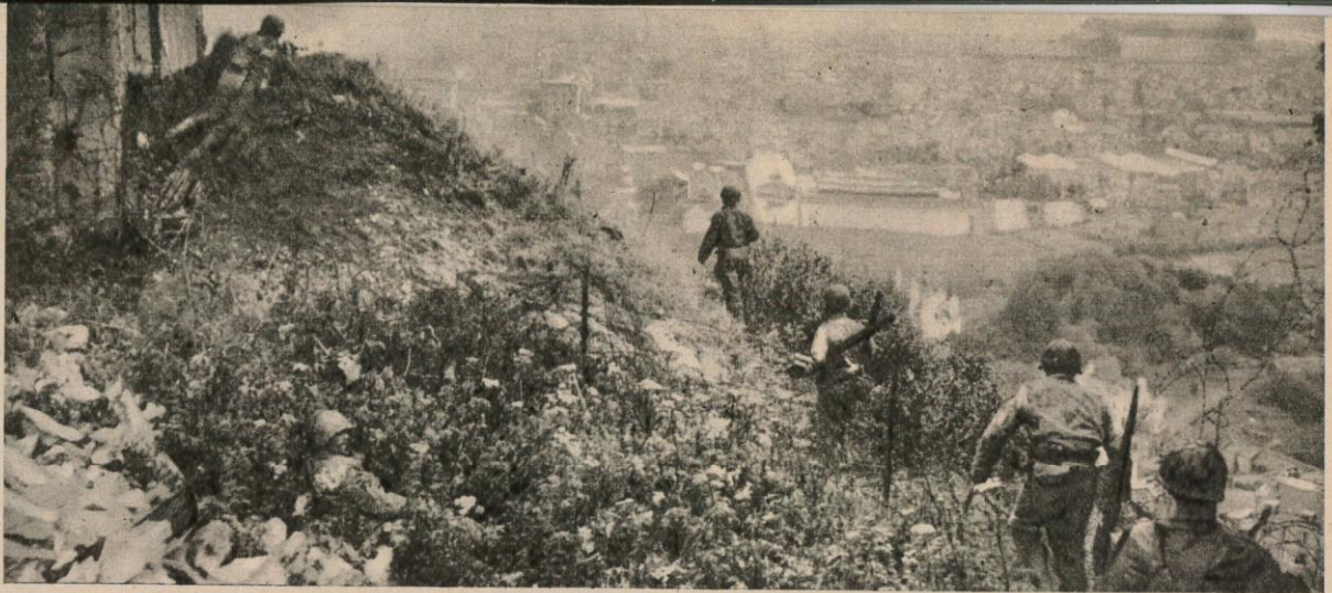
CLEF DE CHERBOURG , le fort du Roule fut un des plus rudes obstacles auxquels se heurtèrent les américains.