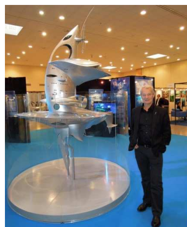
Jacques Rougerie et SeaOrbiter

En 1974, il crée le Centre d'Architecture de la Mer et de l'Espace (CAME) et reçoit le Prix de l'Union Internationale des Architectes en 1981.