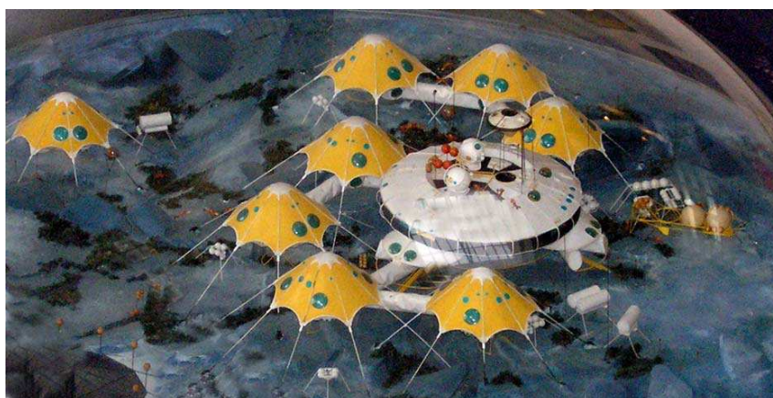
Le Village sous-marin © Jacques Rougerie

Parmi ses œuvres majeures et nombreuses, il réalise des projets d'habitats sous-marins à vocation scientifique comme le Village sous-marin . Situé entre 30 et 40 mètres de profondeur, ce village peut accueillir entre 50 et 250 aquanautes. Son architecture est adaptée à l'étude et à la gestion subaquatique, notamment pour le développement des techniques d'aquaculture en pleine mer d'animaux et de végétaux marins. Le village est aussi pensé pour servir de base d'entraînement sous la mer aux astronautes de la NASA ( National Aeronautics and Space Administration ).