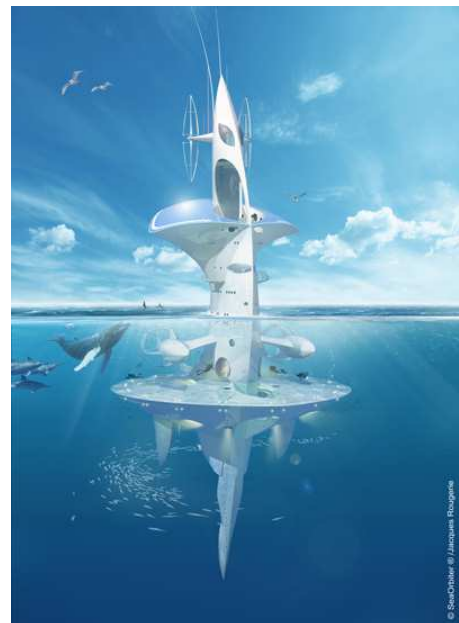
SeaOrbiter © Jacques Rougerie

Les conditions de vie dans le simulateur spatial de SeaOrbiter sont similaires aux conditions de vie d'un module spatial. Les astronautes de l'ESA ( Agence Spatiale Européenne ) et de la NASA pourront s'y entraîner pour leurs futurs vols de longue durée à destination des astéroïdes ou de la planète Mars.