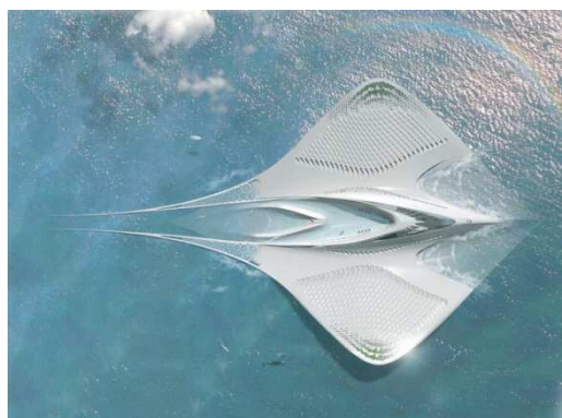
La Cité des Mériens