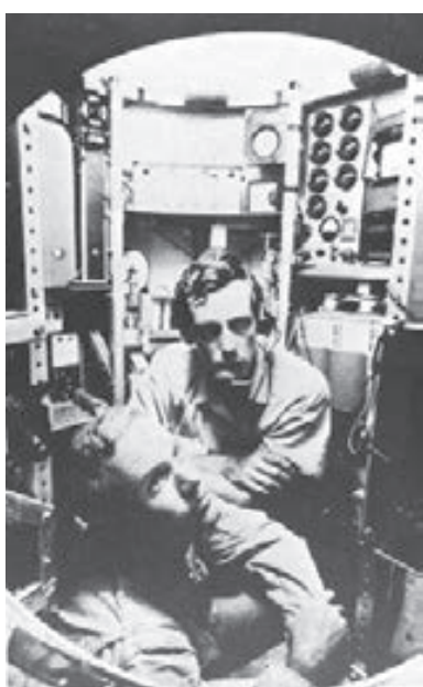
Don WALSH et Jacques PICCARD à bord du Trieste

Le 23 janvier 1960, à 8h10, Don WALSH et Jacques PICCARD s'enfoncent vers la fosse des Mariannes à bord du Trieste .