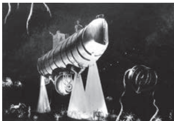
Illustration du Trieste

En 1989, l'Institut d'océanographie P. P. Shirshov de Moscou fait appel à lui pour la création d'une entreprise de maintenance sous-marine, la Soyuz Marine Service.