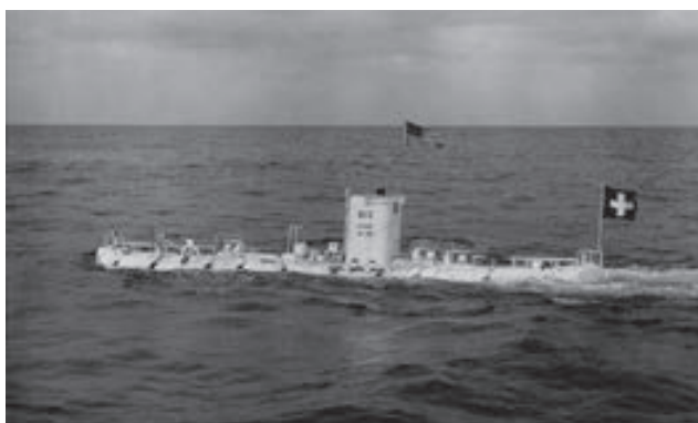
Le Trieste avec les drapeaux américain et suisse.

Émus, Don WALSH et Jacques PICCARD se taisent et observent les fonds. Ils aperçoivent un poisson plat dans le halo de lumière de leur engin. Les deux hommes apportent la preuve irréfutable de la présence de vie dans les abysses.