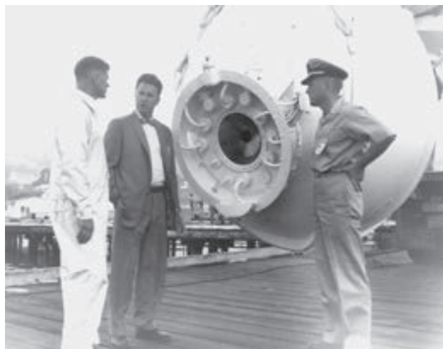
Don WALSH devant la sphère habitable du Trieste

L'objectif des États-Unis est de découvrir un endroit dépourvu d'oxygène et de vie, où l'on peut en toute quiétude entreposer des déchets nucléaires.