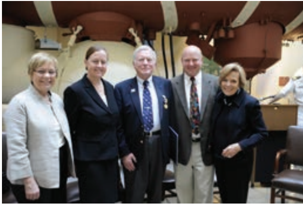
Don WALSH entouré des équipes du Woods Hole Oceanographic Institution et de Sylvia EARLE (à droite)